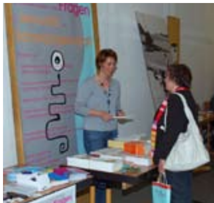
Zahlreiche Infostände informierten die Besucher über Angebote für Frauen in Stadt und Landkreis Hof

VHS, Mütterclub, Mehrgenerationenhaus Hof, Jugendhilfhaus St. Elisabeth, Psychologische Beratungsstelle, Agentur für Arbeit, Frauenbeauftragte der Stadt Hof, Gleichstellungsbeauftragte Landkreis Hof, Schwangerenberatungsstelle Landkreis Hof, Caritasverband, Freunde der Internationalen Hofer Filmtage, Soroptimist International Club Hof, Deutsche Rentenversicherung, Frauenklinik Hof, Diakonie Hochfranken, Migrationsdienst. EJSa und andere.