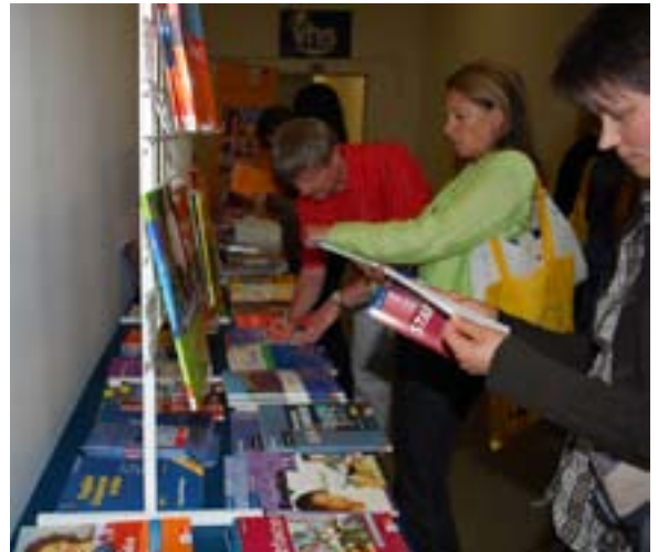
Mehr als 70 Kursleiter besuchten den ersten oberfränkischen Sprachentag im Bildungszentrum der VHS Landkreis Hof

Das Internet als neues Leitmedium werde auch den Sprachenbereich beeinflussen. Neue Kursangebote, alternative Lernorte und vermehrt zielgruppenspezifische Angebote spielten in der Erwachsenenbildung eine immer größere Rolle. Loibls Fazit: Die Kursleiter