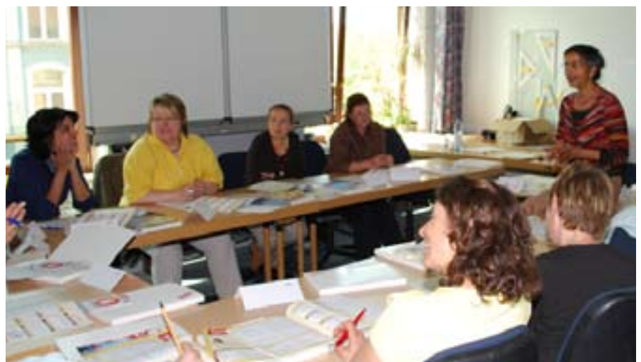
In zahlreichen Workshops erarbeiteten die Teilnehmerinnen neue Methoden für den Sprachunterricht

Am Ende der Veranstaltung zogen die Teilnehmer ein rundum positives Fazit und äußerten den Wunsch nach einer Wiederholung des Sprachentags.