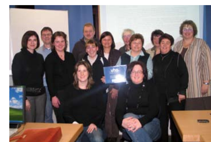
Die Schulung „Modern Office für Handwerkerfrauen“ unterstützte gerade kleine und mittlere Unternehmen bei der Einführung moderner Software

HOF – Die VHS ist bei den heimischen Betrieben als Partner für die Weiterbildung ihrer Beschäftigten sehr geschätzt. Dies zeigt sich sowohl an der regen Beteiligung am Abendkursprogramm, aber auch an speziellen Inhouse-Schulungen. In den vergangenen beiden Jahren stellen wir eine deutliche Zunahme fest: Allein im Dezember 2007 liefen parallel 23 Firmenschulungen, die von unserem Bildungszentrum geplant und durchgeführt wurden. Eine Hälfte davon entfiel auf Fremdspra-