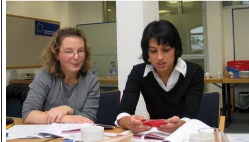
Wie kann man Sprachkurse noch interessanter gestalten? Dieser Frage gingen Lehrkräfte und Dozenten der VHS bei einem Wochenendseminar nach. Ein Münchner Verlag stellte das Konzept „Lernkrimi“ vor. Hier wird die Spannung der Geschichte genutzt, um das Interesse am Sprachenlernen zu schüren. Die Dozenten waren begeistert – und haben bereits erste Kurse mit dem neuen Medium geplant.