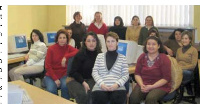
„Wie bewirbt man sich richtig?“, fragte sich kürzlich eine Besuchergruppe der EJSa im Bewerbungscenter der VHS